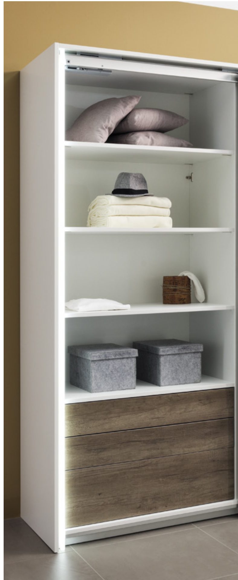
Quadro 4D Quadro