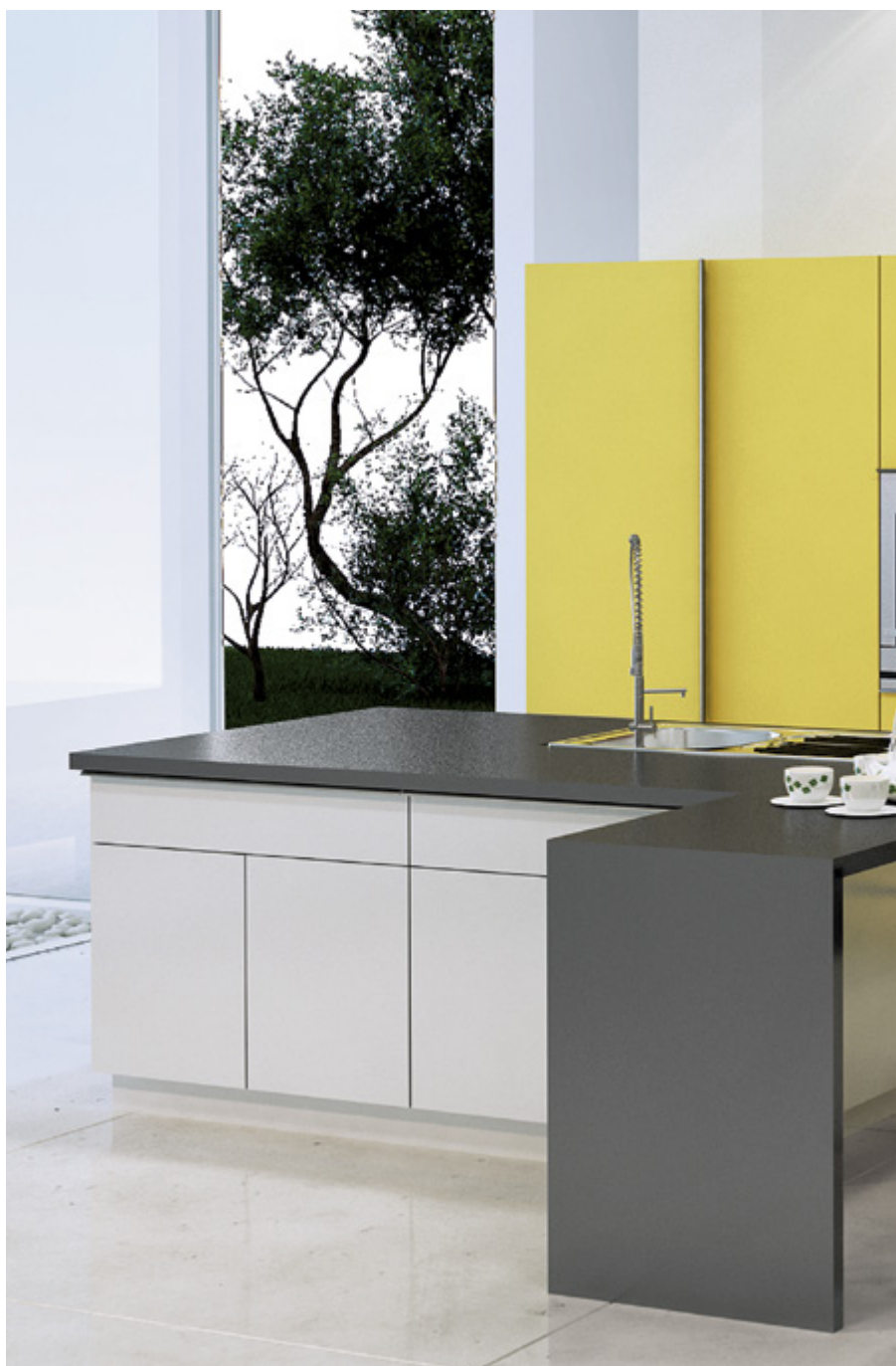
ArciTech w kolorze srebrnym