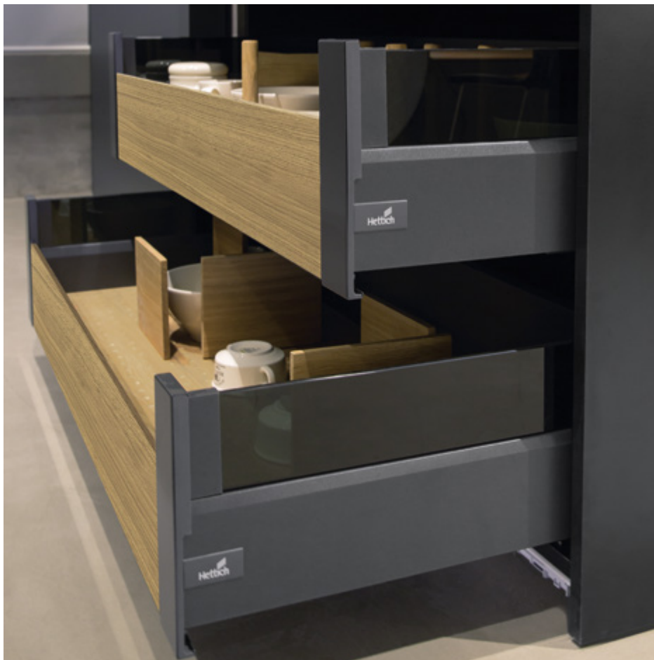
ArciTech w kolorze antracytowym