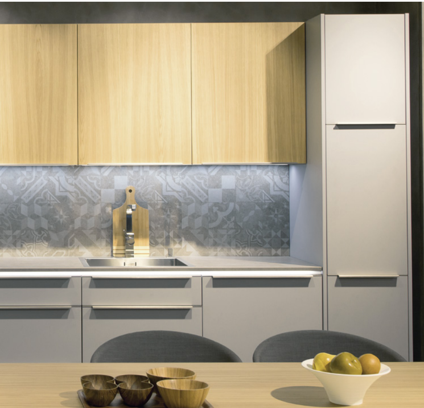
ArciTech w kolorze szampańskim