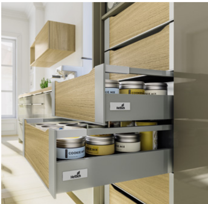
InnoTech Atira w kolorze srebrnym