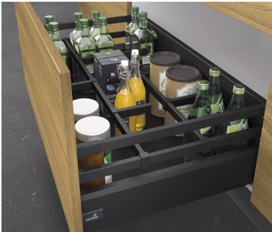
ArciTech w kolorze antracytowym