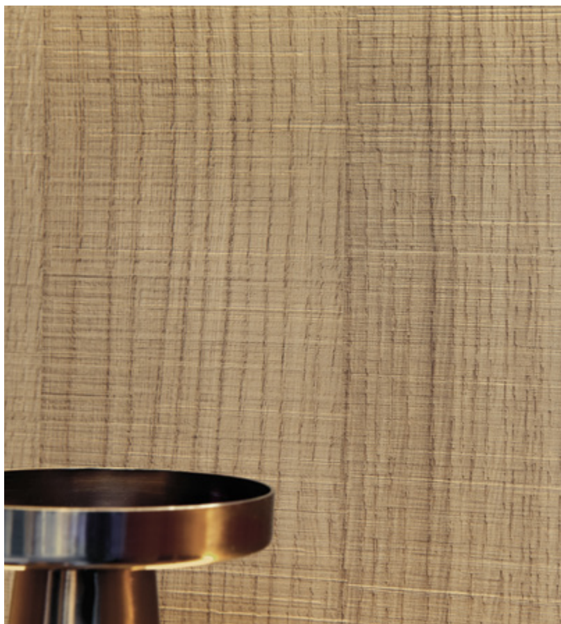
ArciTech w kolorze antracytowym