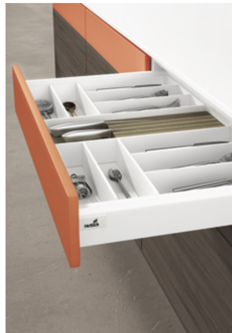
ArciTech w kolorze białym