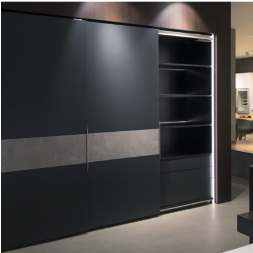
ArciTech ze stali nierdzewnej