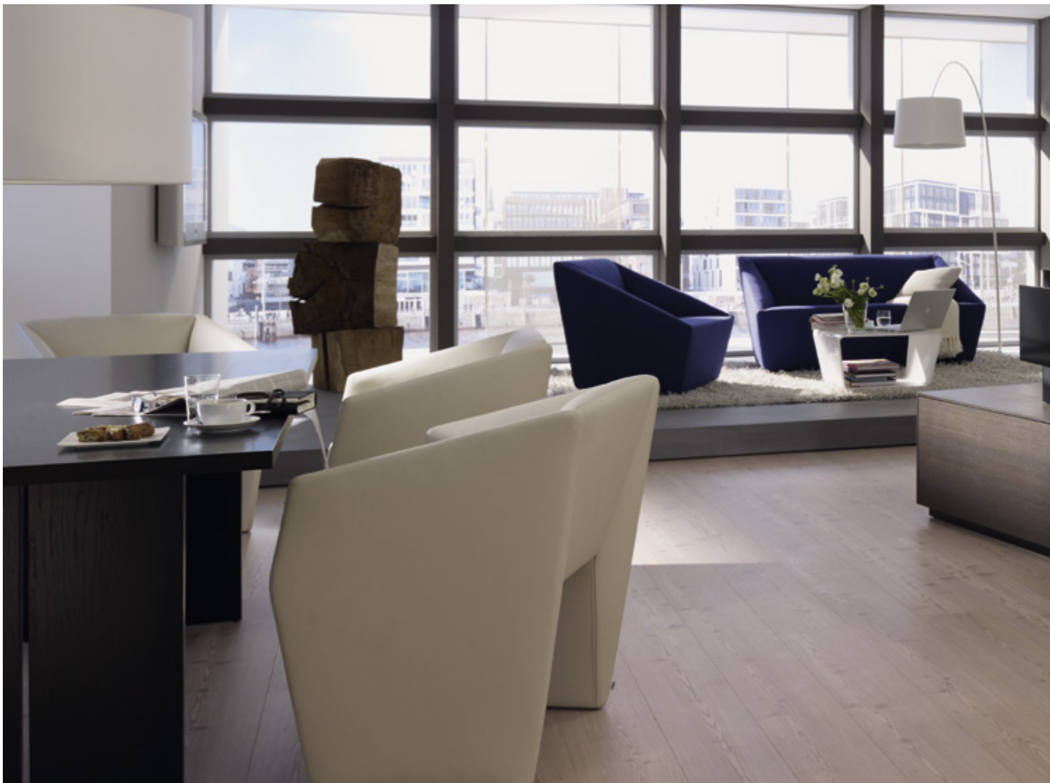
ArciTech w kolorze srebrnym