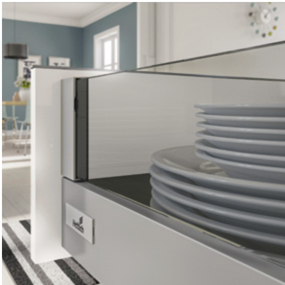
InnoTech Atira w kolorze srebrnym