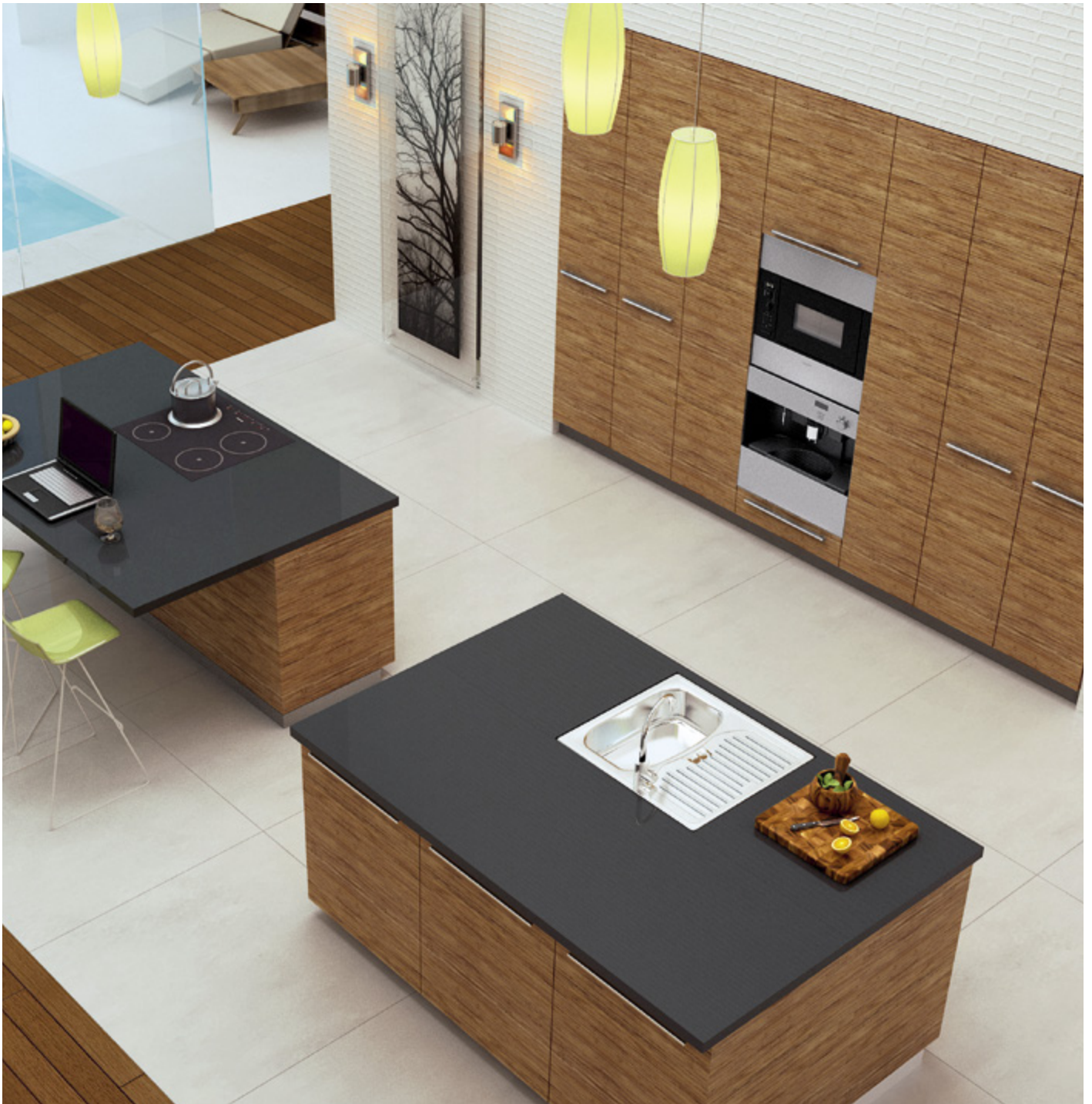
InnoTech Atira w kolorze białym