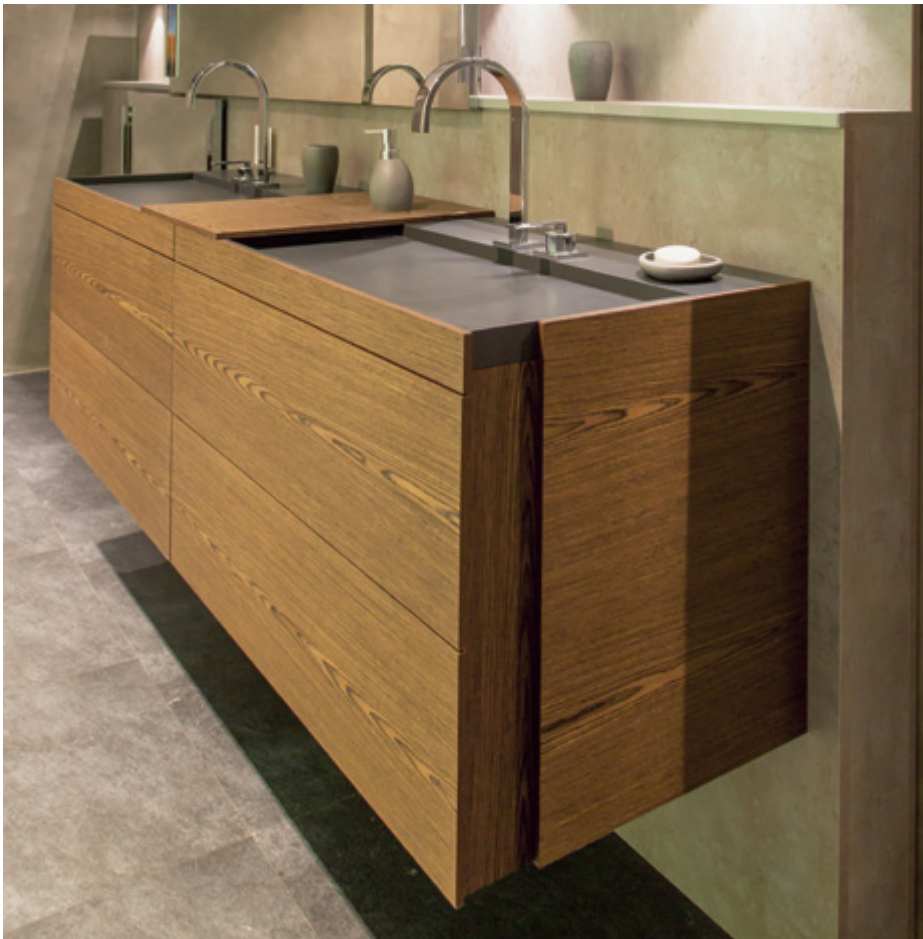
ArciTech w kolorze antracytowym