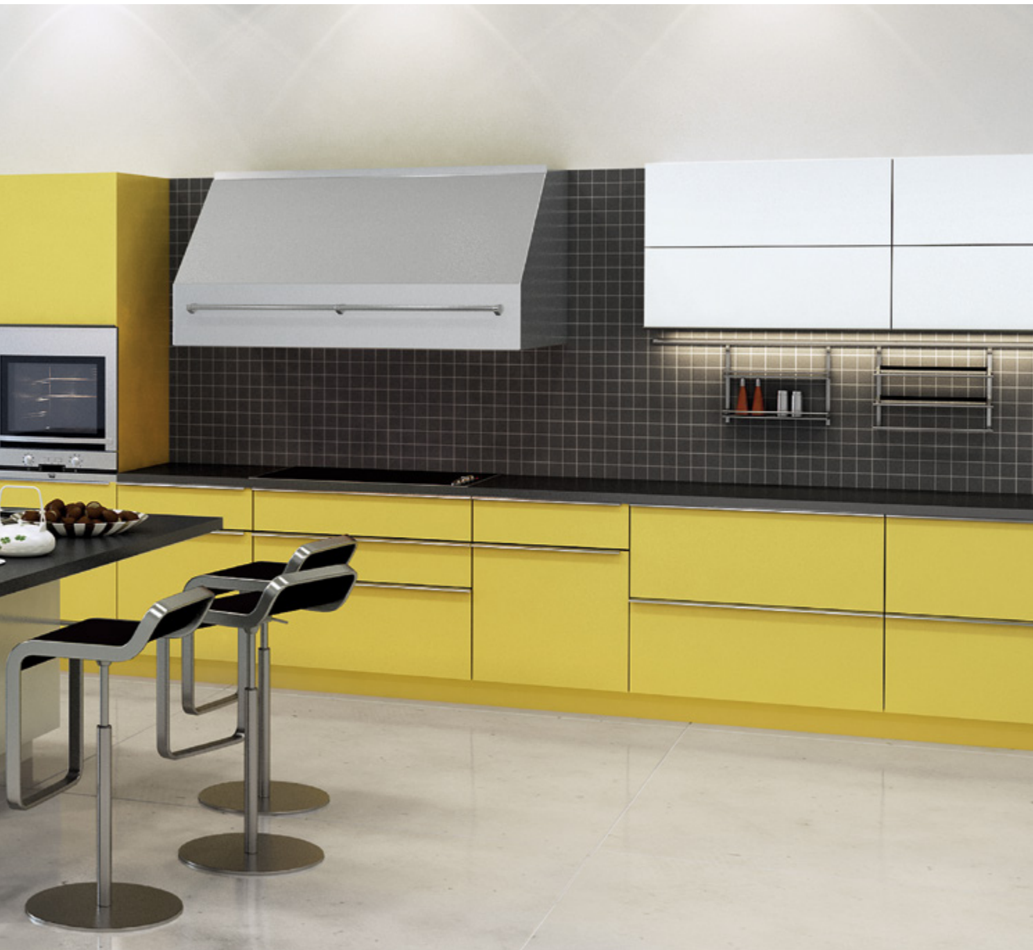
ArciTech w kolorze srebrnym