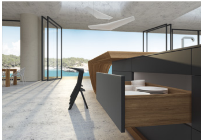
Quadro 4D Quadro