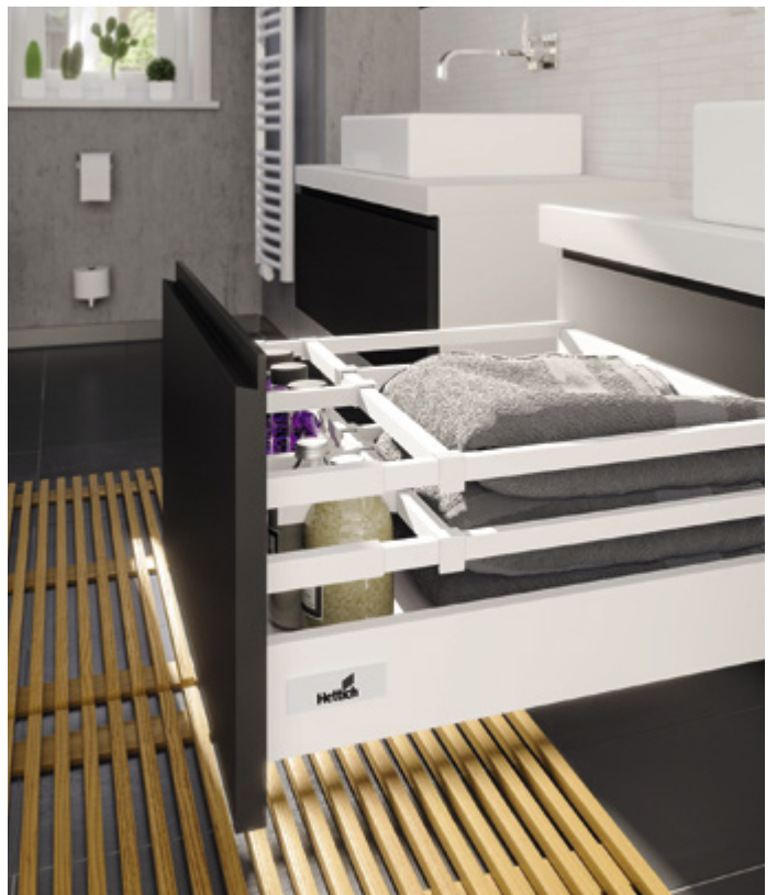
InnoTech Atira w kolorze białym