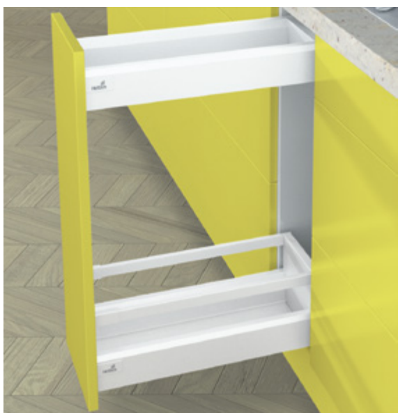
ArciTech w kolorze białym