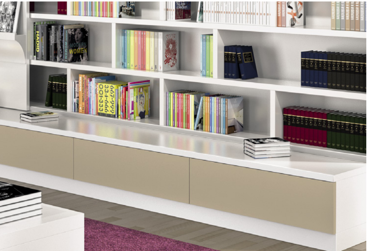
ArciTech w kolorze szampańskim