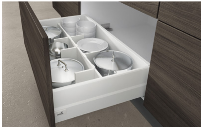
ArciTech w kolorze białym