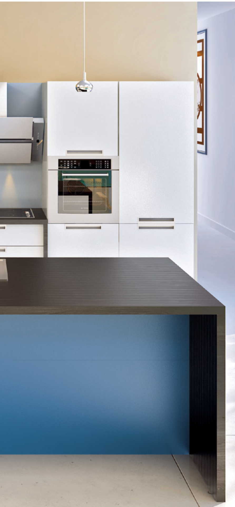
ArciTech w kolorze srebrnym