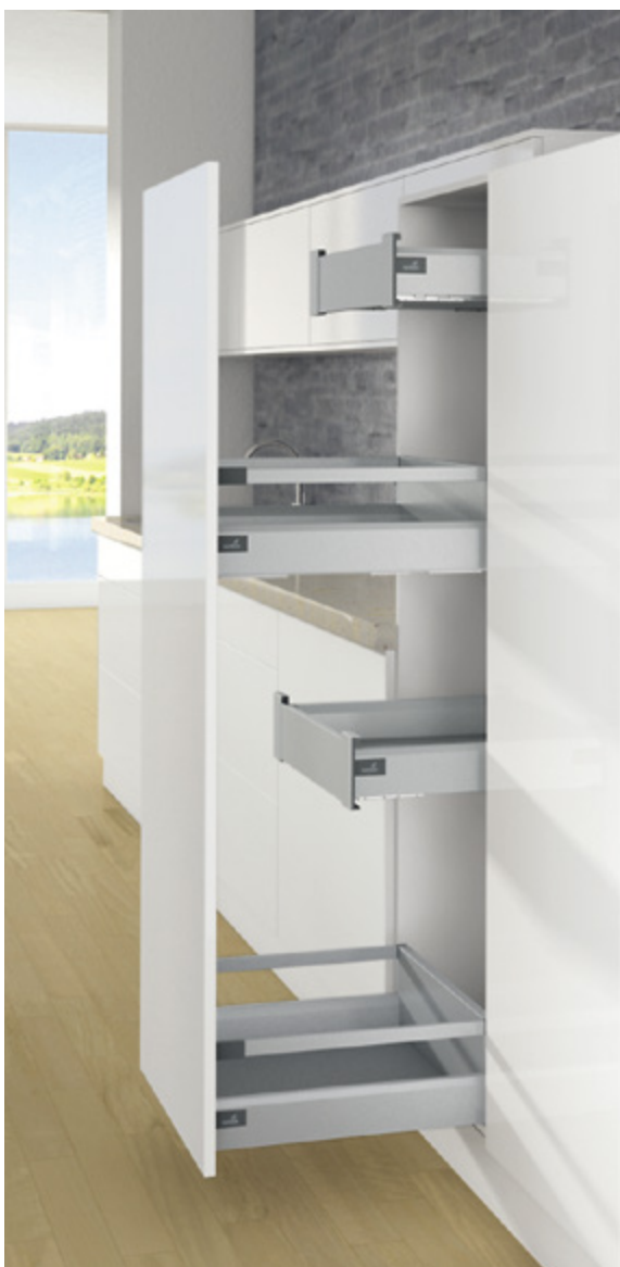
ArciTech w kolorze srebrnym