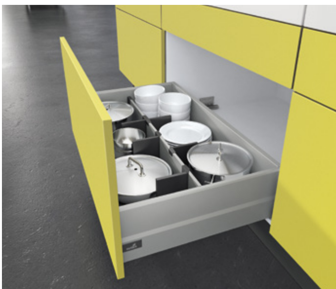
ArciTech w kolorze srebrnym