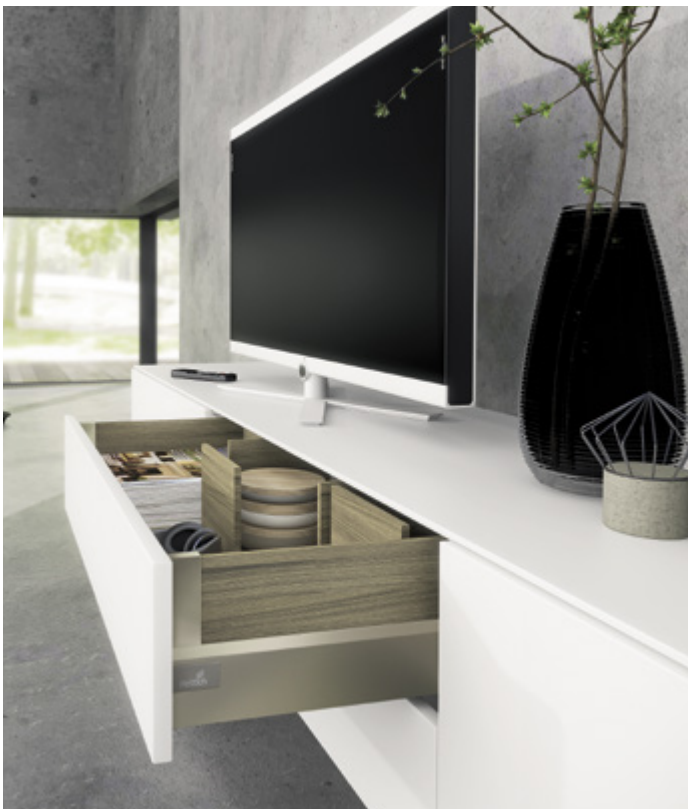
ArciTech w kolorze szampańskim