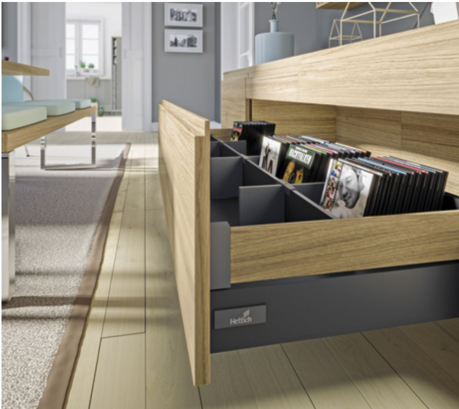
InnoTech Atira w kolorze antracytowym