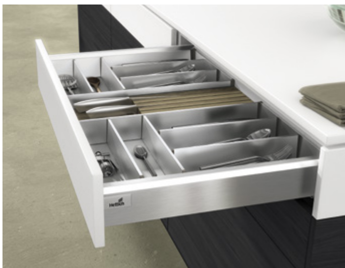
ArciTech ze stali nierdzewnej

Ciemne kolory, takie jak czarny czy antracytowy, tworzą idealny kontrast dla stali nierdzewnej lub aluminium, z których wykonane są np. urządzenia AGD czy uchwyty.