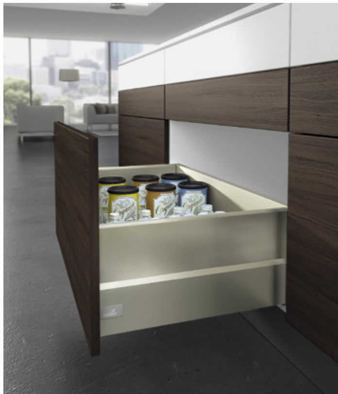
ArciTech w kolorze szampańskim